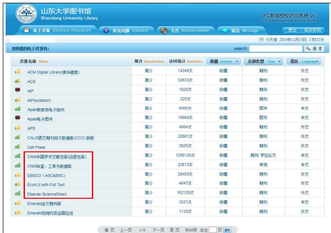
图 15.2 山东大学图书馆电子资源首页